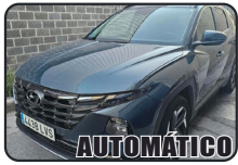
HYUNDAI TUCSON 1.6 TGD, PHEV, 265 cv, año 21, 101.800 kms, 26.900€