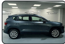
SEAT ATECA 1.0 TSi, 115 cv, Style, año 18, 70.694 kms, 17.500€