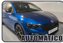
SKODA SCALA 1.5 TSi, 150 cv, Montecarlo, año 22, 22.000 kms, 23.900€