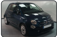
FIAT 500 1.2 8v, 69 cv, Lounge, año 18, 39.405 kms, 9.900€