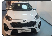
KIA SPORTAGE 1.6 MHEV, 136 cv, GT Line Essential, año 21, 173.000 kms, 17.500€