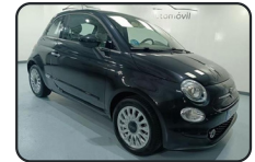
FIAT 500 1.2 8v, 69 cv, GLP, Lounge, año 19, 105.980 kms, 9.900€