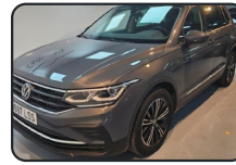
VW TIGUAN 1.5 TSi, 150 cv, Life, año 21, 118.000 kms, 19.900€