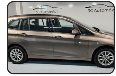
BMW GRAN TOURER 216d, 116 cv, Business, año 19, 44.800 kms, 19.900€