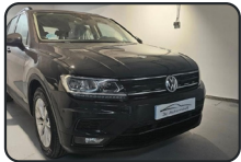
VW TIGUAN 2.0 TDi, 150 cv, Advance, año 19, 218.000 kms, 17.800€