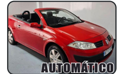
RENAULT MEGANE 1.6i, 115 cv, Cabrio, Confort Dynamique, año 05, 116.000 kms, 4.900€