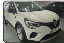
RENAULT CAPTUR TCe, GLP, 100 cv, Intens, año 21, 88.000 kms, 15.900€