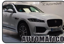
JAGUAR F-PACE 2.0L, i4D, 240 cv, RSport, año 18, 160.000 kms, 22.000€