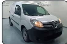
RENAULT KANGOO 1.5 DCi, 75 cv, Profesional Energy, año 16, 137.667 kms, 9.900€