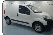
FIAT FIORINO 1.3 Mjet, 75 cv, Cargo Base, año 14, 112.180 kms, 6.500€