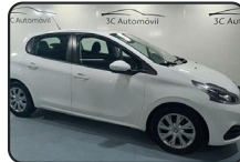
PEUGEOT 208 BlueHDi, 100 cv, Active, año 19, 193.803 kms, 7.900€